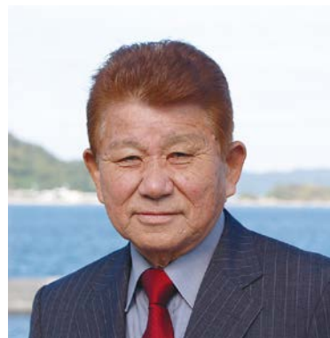
上関町まちづくり連絡協議会